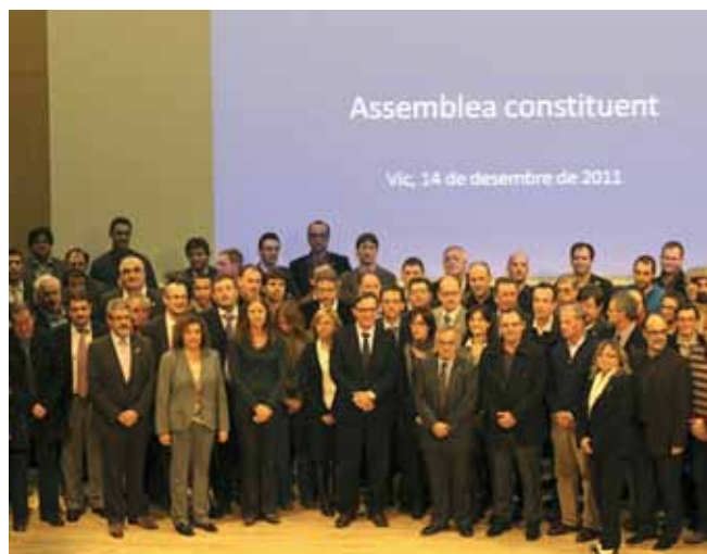
Representants a l'Assemblea