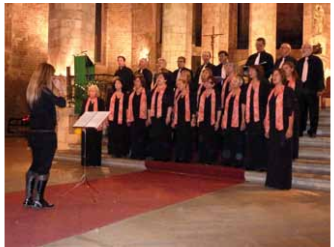
Santa Maria del Mar (Barcelona) - 27/11/2011