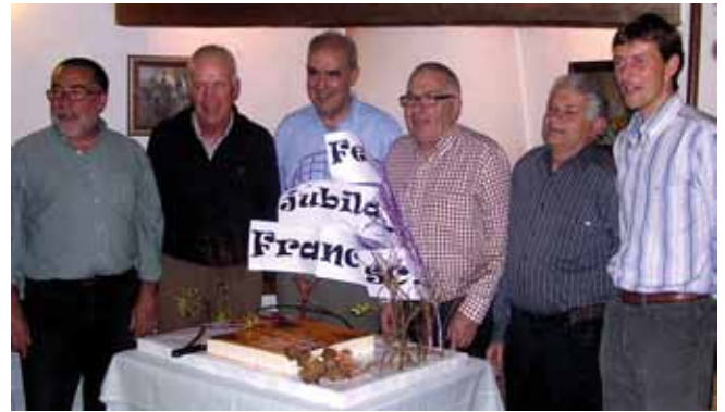
Dinar de despedida amb tots els alcaldes de la democràcia

M'agrada molt la jardineria, deixar els jardins ben arreglats i que facin goig, i també m'agrada molt el bricolatge, i per l'Ajuntament he hagut de fer moltes feines d'aquest tipus. ■